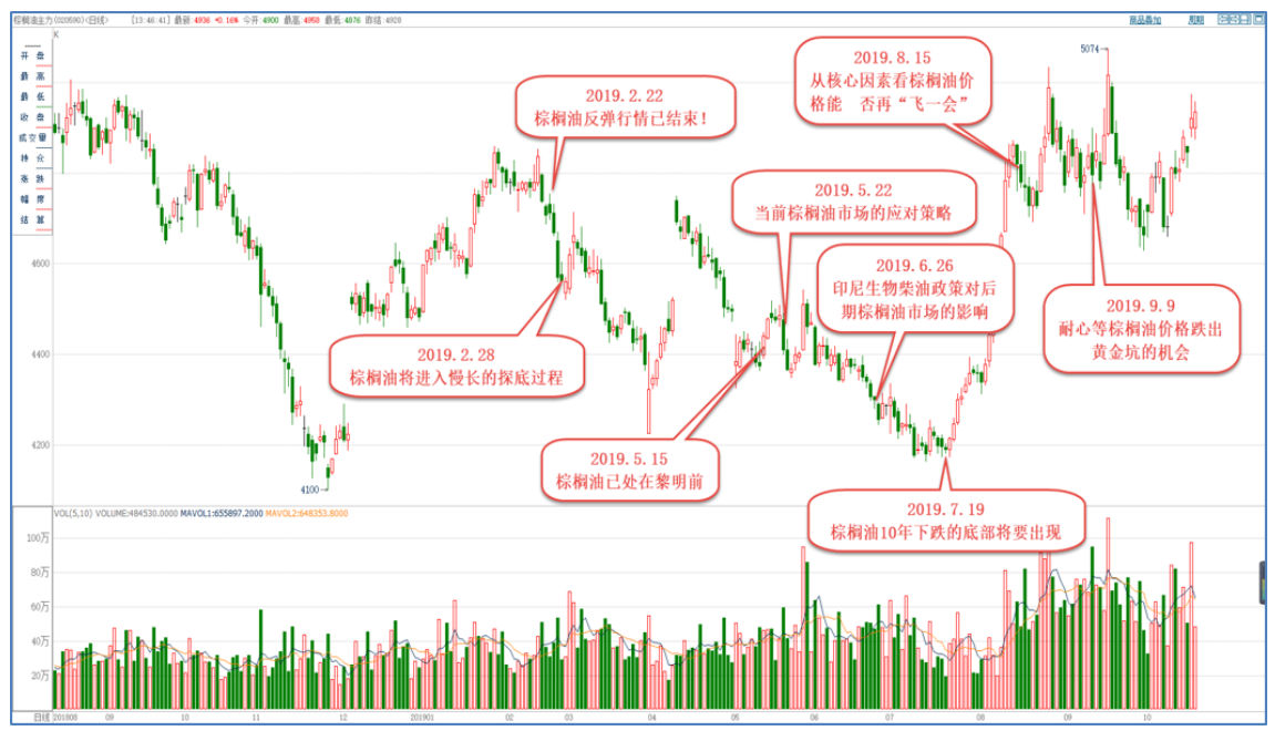
图 2：策略报告与行情结合图

笔者不定期在相关网站发表农产品分析报告，主要是通过供需等基本面的分析，跟踪现货市场的变化，再结合商品期货走势，表达对商品的中长期走势判断。由于文章间隔时间长，在不同网站上发表也较为零碎，所以特意汇总在下表中。文章中罗列了详细的数据，通过分析尽可能得到明确的观点，由于主要从基本面分析供求变化，因此有较强的持续性。结合本日报的中短期策略，让投资者对该品种有更全面的了解，敬请关注，希望有助于大家的期货交易。