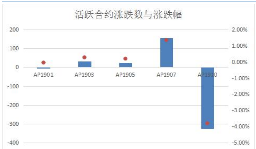
图 1：苹果期货活跃合约涨跌数与涨跌幅

本周苹果期货陷入窄幅震荡。截止本周五收盘，AP1901 合约周下跌 5，跌幅为 0.04%；AP1903 合约上涨 32，涨幅为 0.28%；AP1905 合约上涨 23，涨幅为 0.20%。持仓和成交量方面，截止周五收盘，AP1901 周成交量为 117.6 万手，较上周减少 35.8 万手，持仓量减少 1.79 万手至 17.5 万手；AP1905 周成交量为 40.4 万手，较上周增加 0.73 万手，持仓量增加 1.66 万手至 15.7 万手。