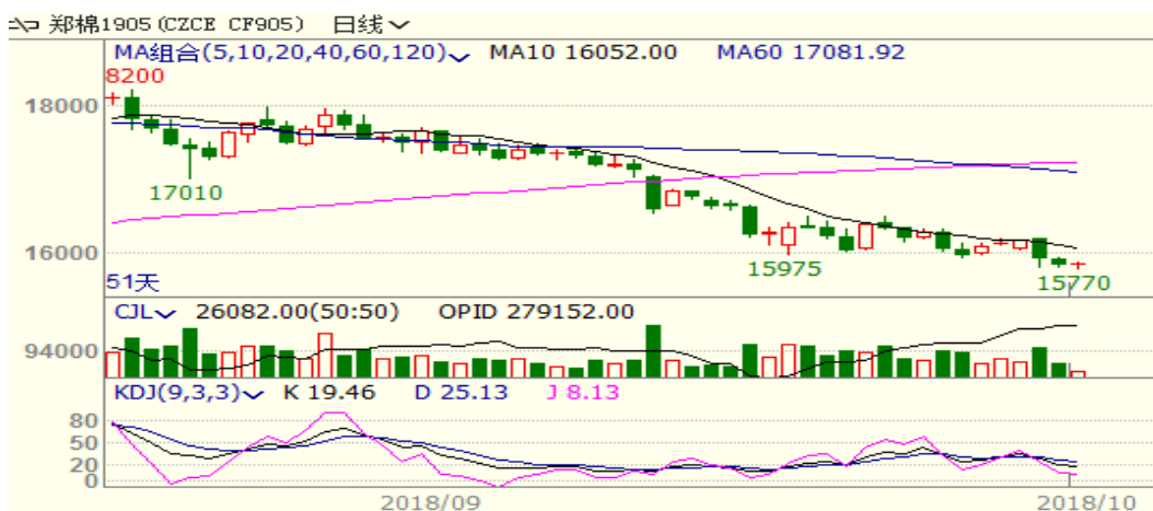
图 1、郑棉主力合约价格走势图

本周，郑棉下跌，至周五收盘跌 160 至 15060，跌幅为 1.05%。周五中国棉花价格指数为 15831 元/吨，与上周相比下跌 67 元/吨。本周新棉上市叠加宏观环境动荡，棉价下跌。从技术面来看，MACD 黏连，KDJ 低位向下，预计短期棉价可能继续偏弱运行。