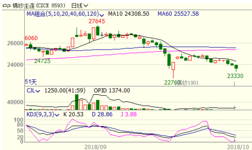
图 3、棉纱主力合约价格走势图

本周，棉纱下跌，至周五跌 265 至 23935，跌幅为 1.10%，中国纱线价格指数 C32S 为 24130 元/吨，与上周相比下跌 60 元/吨。近期纺织企业产销率下滑，库存增加，棉纱价格承压。从技术面来看，MACD 绿柱扩大，KDJ 低位，预计短期棉纱价格可能继续震荡偏弱。