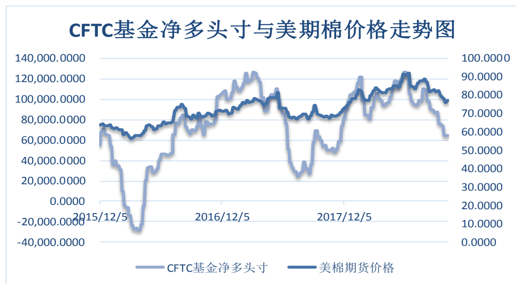
图 7、ICE 非商业净多头持仓