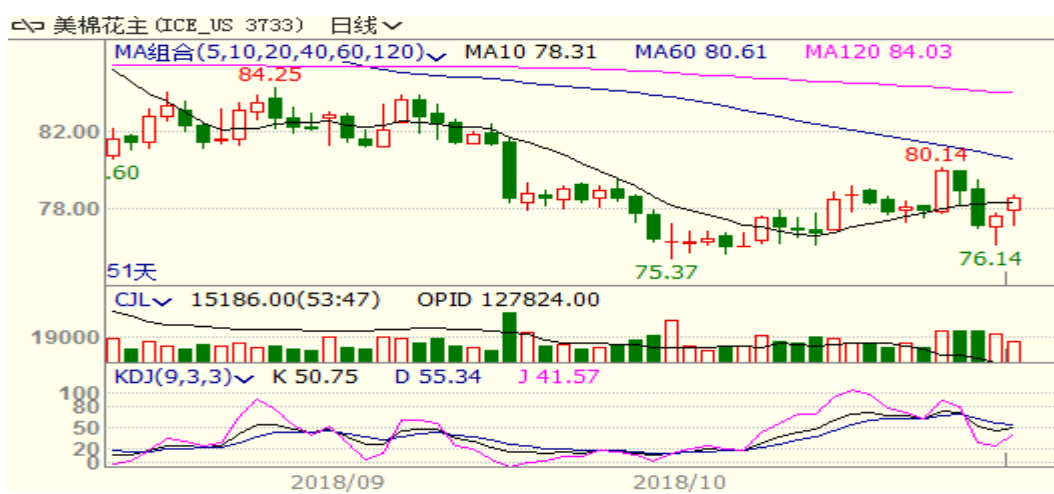
图 2、美棉主力合约价格走势图

外盘，本周美棉震荡下跌下跌，至周五跌 0.62 至 78.52，跌幅为 0.80%。本周棉花生长优良率继续下滑，但是出口销售低迷与外围市场下跌压制棉价。从技术面来看，MACD 红柱扩大，KDJ 拐头向上，预计短期美棉可能小幅震荡反弹，75 美分附近有一定的支撑。