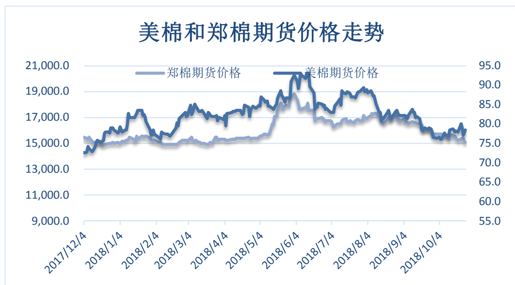
图 4、郑棉与美棉价格走势图