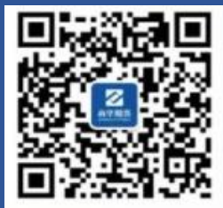
南华期货微信公众号