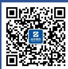
南华黑色投研札记