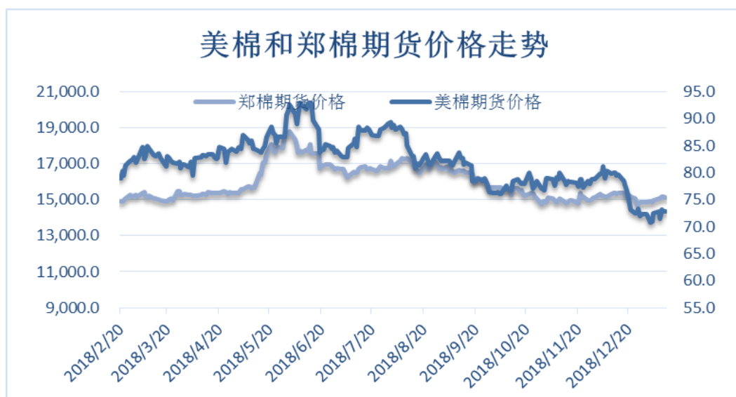
图 4、郑棉与美棉价格走势图