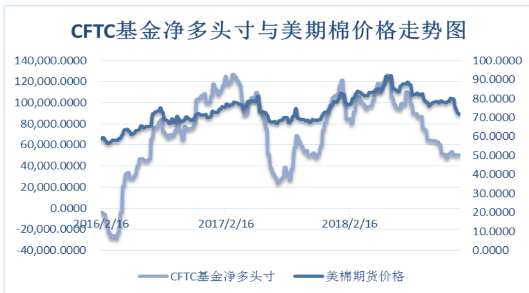
图 7、ICE 非商业净多头持仓