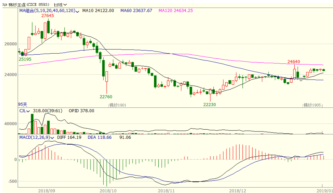
图 3、棉纱主力合约价格走势图

本周，棉纱上涨，至周五涨 95 至 24245，涨幅为 0.39%，中国纱线价格指数 C32S 为 23140 元/吨，与上周相比下跌 40 元/吨。临近春节假期，纺企去库存意愿加强，但近期市场情绪有所恢复支撑价格。从技术面来看，MACD 红柱缩小，KDJ 高位拐头，预计短期棉纱价格可能震荡调整。