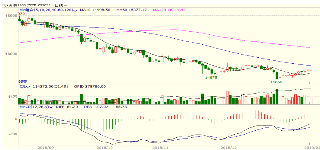
图 1、郑棉主力合约价格走势

本周，郑棉上涨，至周五收盘涨 185 至 15140，涨幅为 1.24%。周五中国棉花价格指数为 15378 元/吨，与上周相比上涨 16 元/吨。本周中美贸易磋商进展顺利，市场情绪有所好转，棉价继续反弹。从技术面来看，MACD 红柱扩大，但 KDJ 高位拐头，预计短期棉价可能震荡调整。