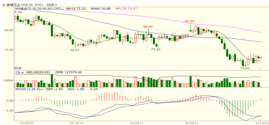
图 2、美棉主力合约价格走势

外盘，本周美棉上涨，至周五涨 0.05 至 72.46，涨幅为 0.07%。本周美国政府继续关门导致市场缺乏基本数据支撑，但是中美经贸协商进展顺利支撑棉价。从技术面来看，MACD 金叉，KDJ 高位，预计短期美棉可能会有震荡调整。