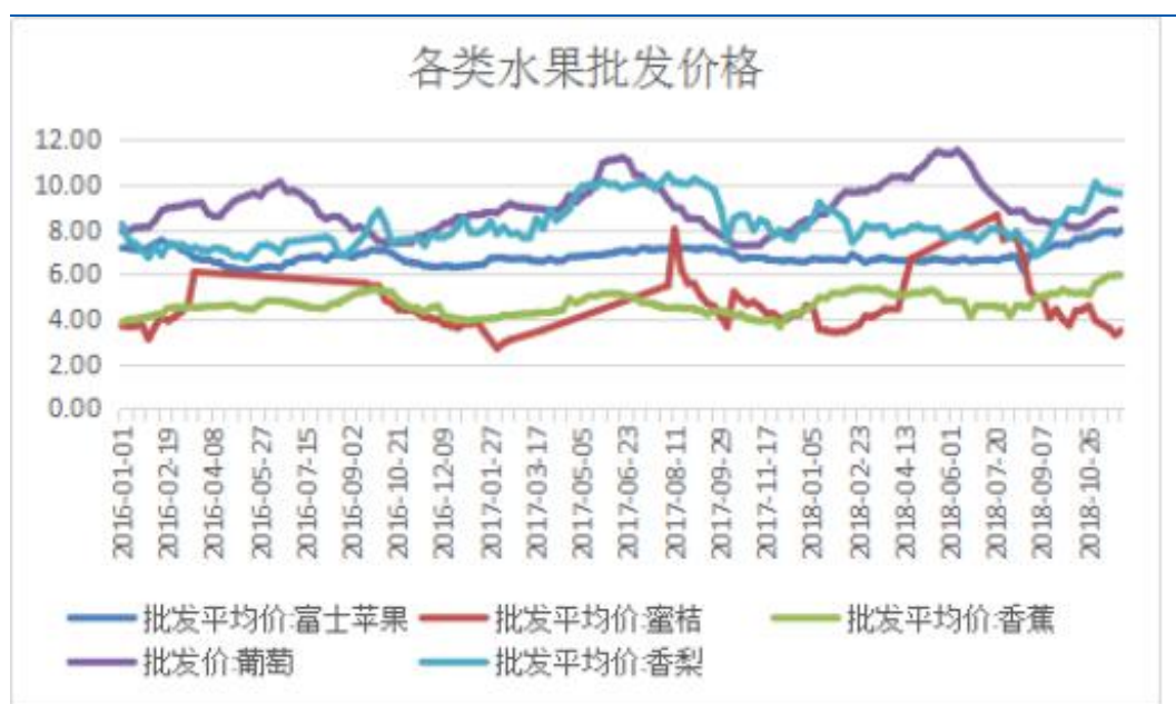
图 3：各类水果批发平均价格

元/公斤；香蕉批发平均价格从上周 5.95 元/公斤涨至 5.91 元/公斤；香梨批发平均价格为 9.59 元/公斤，和上周持平。从批发市场市场的水果报价来看，今年大宗水果价格整体相比于去年同期有所上涨，其中香蕉、梨、葡萄分别较去年同期上涨 30%–40%、20%–25%、5%–15%，而蜜桔相比去年下跌 1 元/公斤左右，跌幅较大。