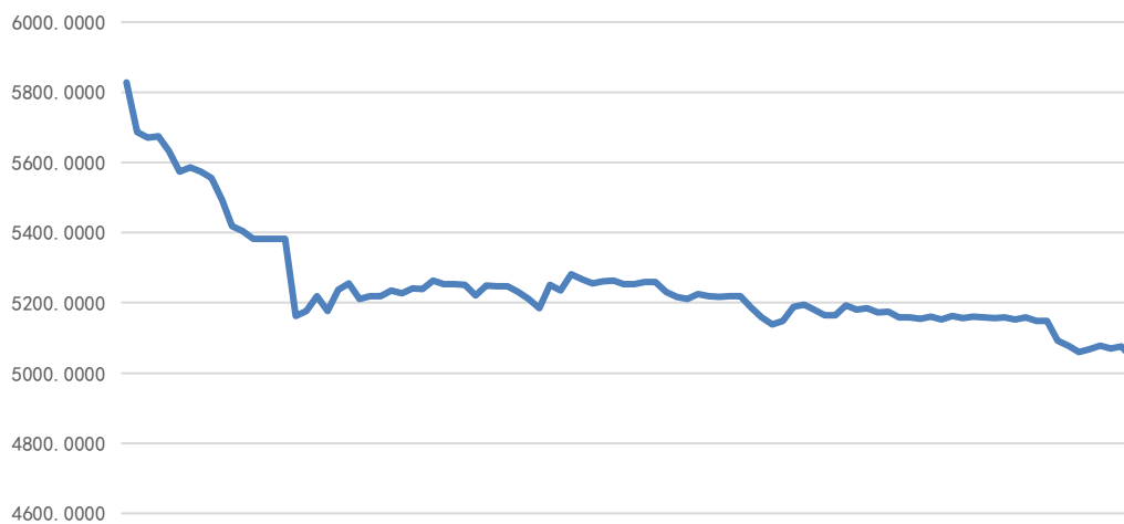
纸浆期货主力合约价格走势