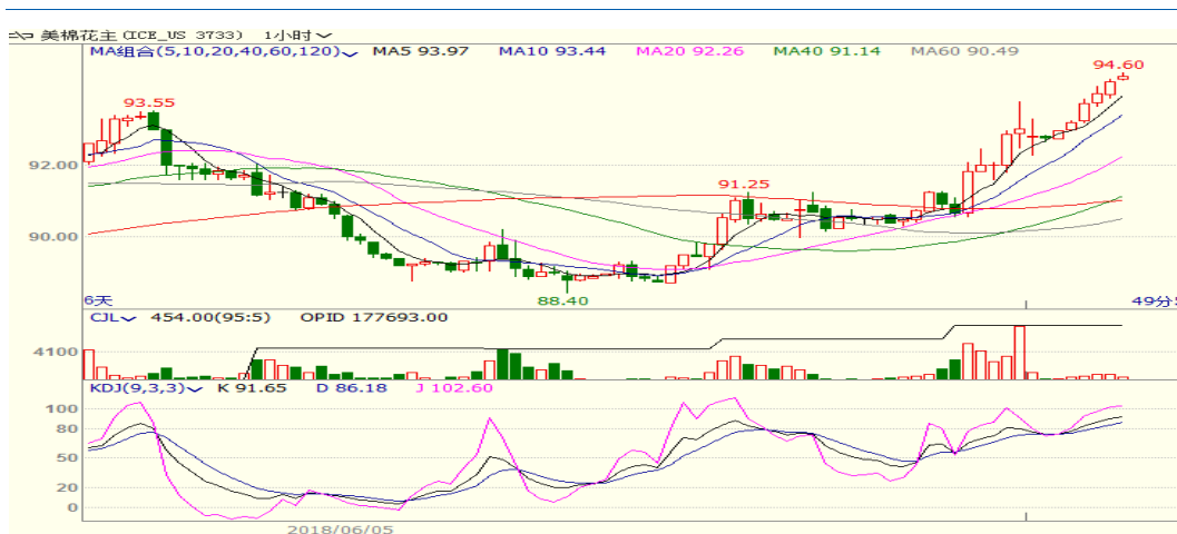
图 2、美棉主力合约价格走势

外盘，本周美棉震荡，至周五跌 0.09 至 92.53，跌幅为 0.01%。本周美棉播种加快当优良率较低，出口销售签约量创年度新低但装运量创年度新高，且美西南棉区旱情依旧，利多美棉市场。从技术面来看，MACD 红柱扩大，KDJ 黏连，预计短期美棉可能继续震荡偏强，支撑位 88 美分附近。