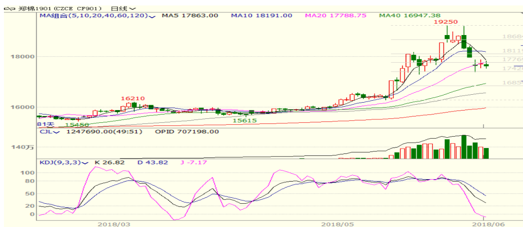
图 1、郑棉主力合约价格走势

本周，郑棉大幅下跌，至周五收盘跌 1190 至 17625，跌幅为 6.32%。周五中国棉花价格指数为 16458 元/吨，与上周相比上涨 294 元/吨。本周中储棉限制非纺织企业参与储备棉竞拍且中棉协发布行业预警称将下放滑准税配额，国储棉轮出降温，棉价承压。从技术面来看，MACD 绿柱扩大，KDJ 向下，预计短期棉价可能震荡反弹，支撑位 17400 附近。