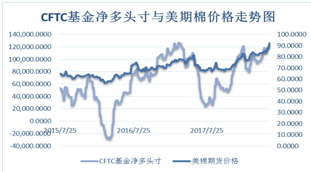
图 4、ICE 非商业净多头持仓