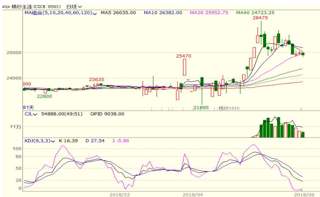
图 3、棉纱主力合约价格走势图

本周棉纱下跌,至周五涨 1090 至 25820,跌幅为 4.05%,中国纱线价格指数 C32S 为 23860 元/吨,与上周持平。本周受棉花大跌影响本周棉纱价格亦大幅回落,且随着纺织品服装市场将逐步进入淡季,预计棉纱价格将继续承压。从技术面来看,本周棉纱大幅下跌,MACD 绿柱扩大,KDJ 低位,预计短期棉纱价格可能继续震荡反弹。